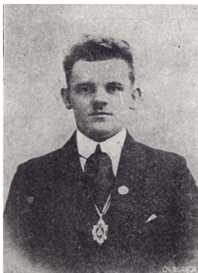
Prezes PZKK Józef Wower

W następnych artykułach omówię działalność sportową klubów i Związku w tamtych latach ,a także przedstawię kluby i bazę kręglarską tamtych lat. /CEGE/