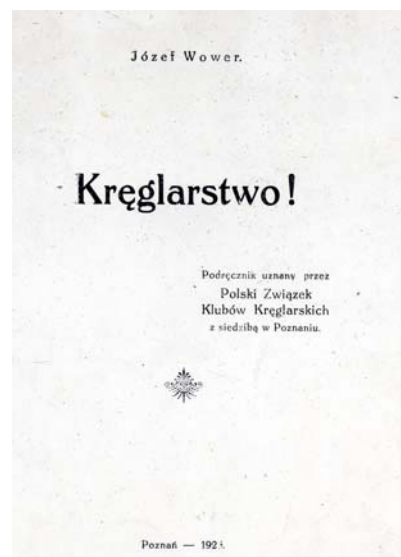
Reprodukcja pierwszej strony broszurki „Kręglarstwo” 1925 r.