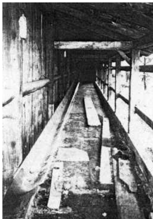
Tor powrotu kul – rynienka wzdłuż toru