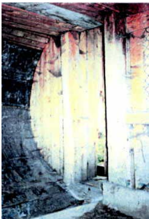
Widok oryginalnego zakończenia torów tzw. wybieg kul z którego kula wpadała do toru powrotu kul.