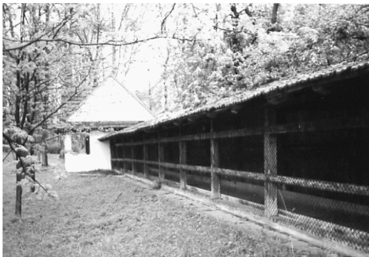
Widok os strony torów