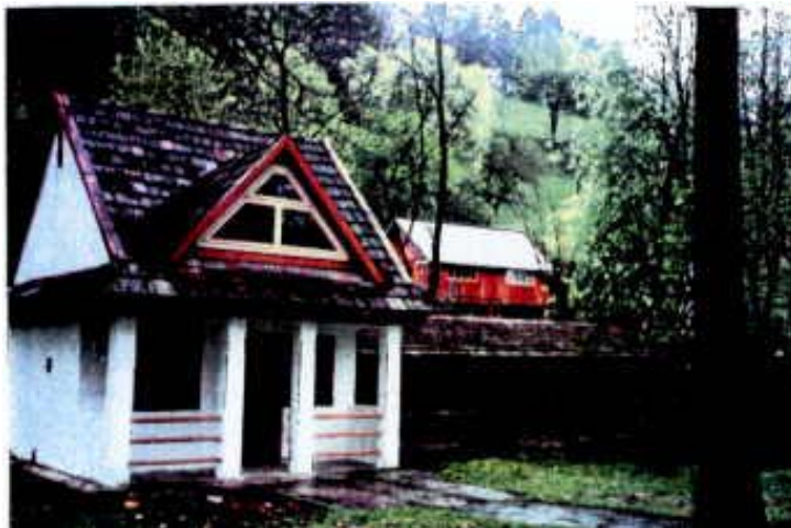
Kręgielnia w Krościenku nad Dunajcem jako przykład oryginalnego polskiego rozwiązania konstrukcyjnego torów kręglarskich (stan z lat 80-tych)

Artykuł ten kończy cykl artykułów omawiających historię kręglarstwa w okresie dwudziestolecia międzywojennego. Starłem się umieścić w nich wszystko co podczas moich badań udało się mnie ustalić, ale zapewne pozostało jeszcze wiele do kontynuowania dalszych badań historii kręglarstwa tego okresu. Dalsze artykuły omawiać będą lata w czasie i po II wojnie światowej do czasu utworzenia kolejnego związku ogólnopolskiego działającego po dzień dzisiejszy./CEGE/